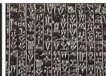
Estela donde se hallan grabadas las 282 leyes del Código de Hammurabi. En la parte superior el rey Hammurabi (en pie) recibe las leyes de manos del dios Shamash. La estela fue encontrada en Susa, a donde fue llevada como botín de guerra en el año 1200 a. C. por el rey de Elam Shutruk-Nakhunte. Actualmente se conserva en el Museo del Louvre (París).