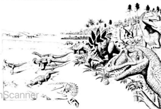
Tabla de tiempo

El más antiguo de los dinosaurios que se ha encontrado es el Eoraptor . No era mayor que un perro grande, pero sí un depredador letal. Vivió hace 225 MDA en lo que hoy es Argentina, en Suramérica.