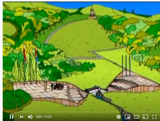
¿El puente de Boyacá actual es el mismo que existió en la batalla del 7 de