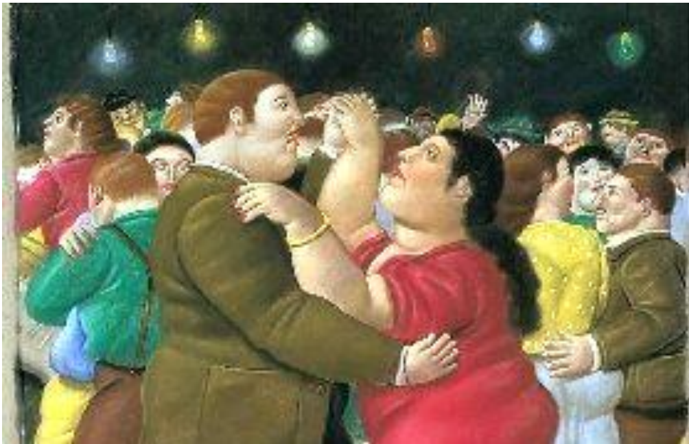
Webgrafía/material fotocopiado (Anexo)

ver: https://www.youtube.com/watch?v=bNcHqNnbQ-s https://www.efe.com/efe/america/cultura/fernando-botero-soy-el-pintor-del-volumen-no-de-las-mujeres-gordas/20000009-3775763