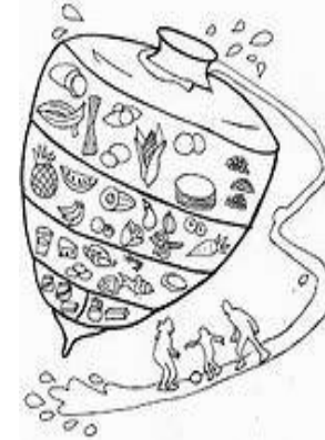
El trompo de los alimentos