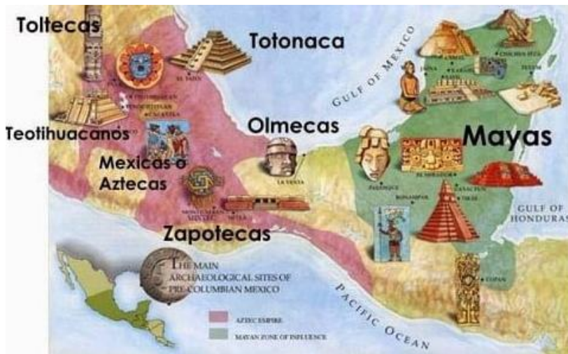
Mapa de las comunidades indígenas de Centroamérica.